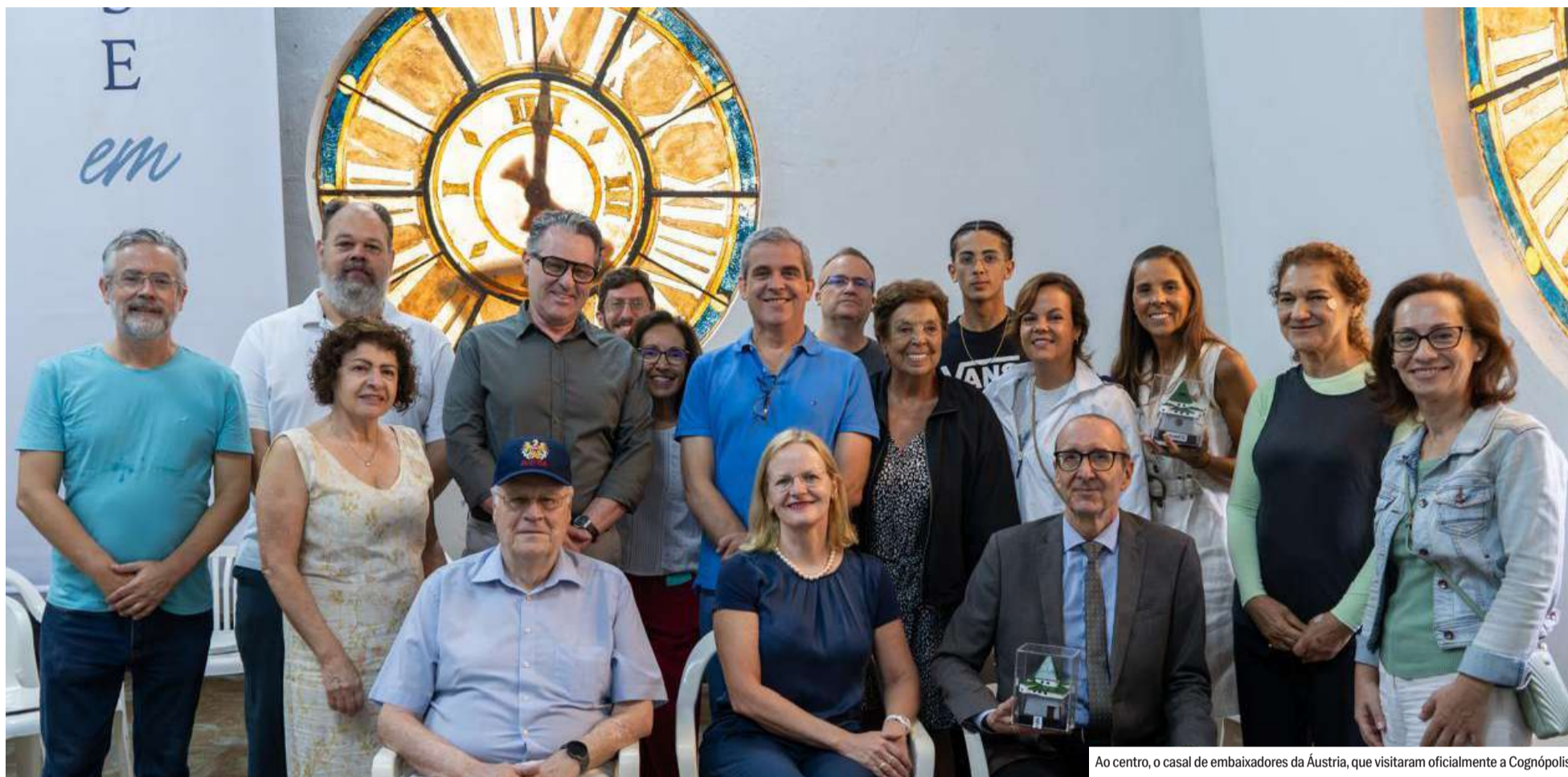
Ao centro, o casal de embaixadores da Áustria, que visitaram oficialmente a Cognópolis.